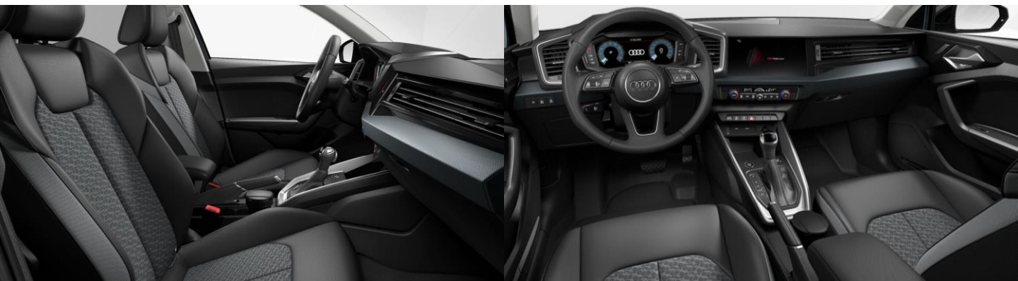
Interior de versiones Sport