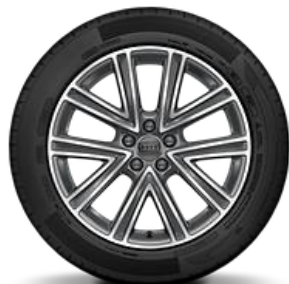
Llanta versión 35 TFSI SPORT