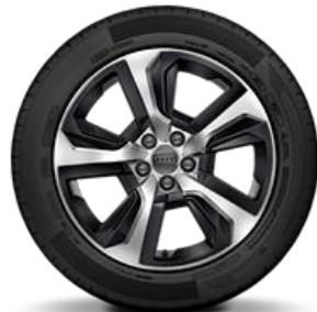
Llanta versiones 30 TFSI y 30 TFSI SPORT